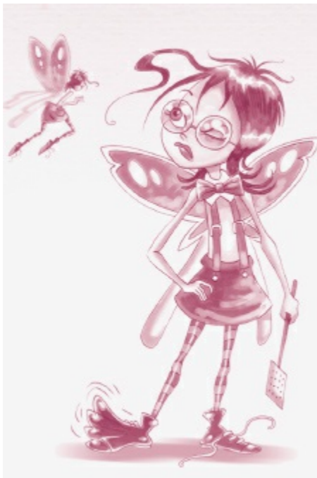
Peter Pan e Wendy

Relatividade das pautas de crescimento – Desejo de crescer – Infância como paraíso – A mãe ideal dos filhos – O filho ideal das mães – O papel da mãe na